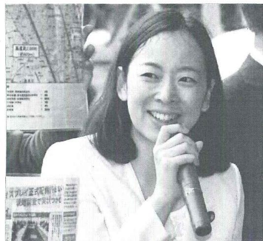
吉良よし子 参議院議員（東京選挙区）