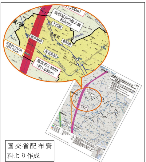
国交省配布資料より作成

高密度都市にある東京都心・豊島区上空を低空で飛行するルートを考えること自体ありえないもので、区民の理解なしにルートを容認することはできないものではありません。