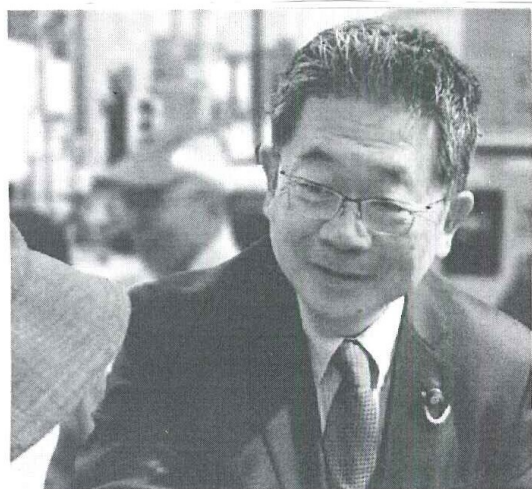
小池 晃 書記局長・参議院議員（比例代表）